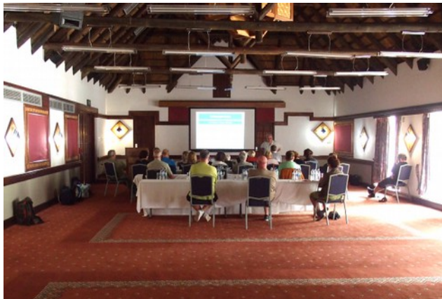
Konferenssalen på Mokuti Lodge

Avresa efter frukost med specialchartrat flyg till Etosha och från flygplanet ser vi det