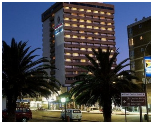
Avani Windhoek Hotel

Windhoek är huvudstad i Namibia och här märks fortfarande att Namibia varit en tysk koloni i det förflutna. Namibia tillhörde Tyskland fram till Versaillesfreden 1919 och det tyska inflytandet gör sig påmint i byggnadsstil och restaurangkultur.