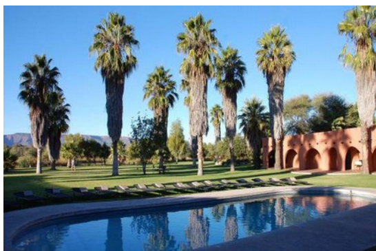
Mount Etjo Logde