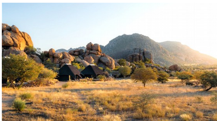
Ai Aiba Rock Painting Logde

San folkens kultur är spännande eftersom människans s.k. arketyper formades sannolikt i den ursprungliga mänsklighetens föreställningsvärld när det gällde religion och moral som sedan kom att avspegla sig på olika sätt i alla de kulturer som kom att utvecklas under mänsklighetens osannolika resa genom världshistorien.