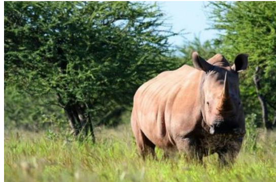
Noshörning i Okonjati Game Reserve