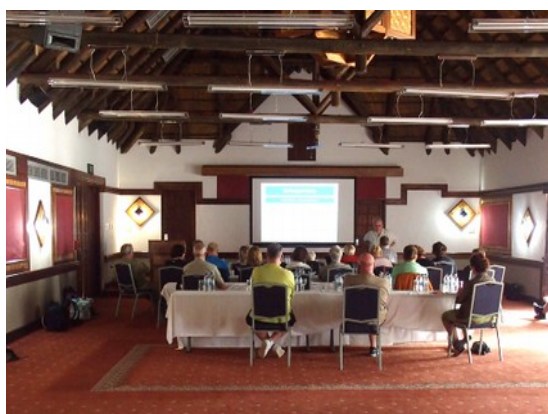
Konferenssalen på Mokuti Lodge

grönare vegetation. Så småningom når vi fram till Namutoni vid östra gränsen av Etosha. Därefter transport till Mokuti Lodge för inkvartering. Middag på lodgen.