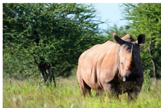
Noshörning i Okonjati Game Reserve

Mount Etjo Lodge är belägen på privat mark och i likhet med många andra storgårdar har man övergått till ecoturism istället för boskapsskötsel. På 1970-talet var Okonjati en överbetad