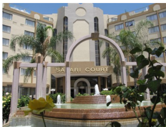
Safari Court Hotel

Windhoek är huvudstad i Namibia och här märks fortfarande att Namibia varit en tysk koloni i det förflutna. Namibia tillhörde Tyskland fram till Versaillesfreden 1919 och det tyska inflytandet gör sig påmint i byggnadsstil och restaurangkultur.