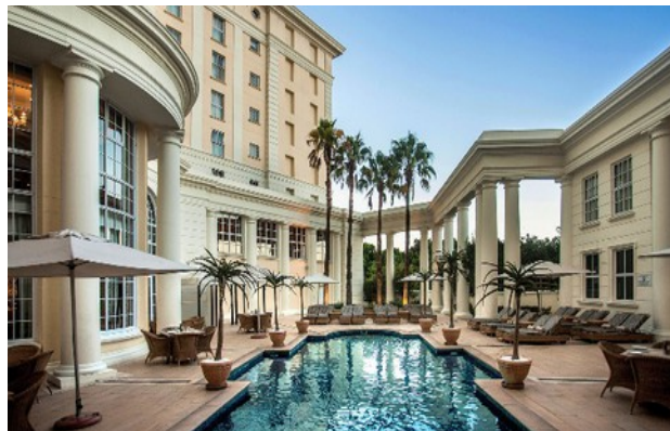
Southern Sun Culinan Hotel