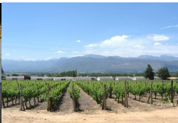
Vinodling utanför Stellenbosch

Incheckning på Protea Hotel Dorpshuis & Spa där kursaktiviteterna kommer att äga rum. Protea Hotel Dorpshuis & Spa är ett fyrstjärnigt hotell med SPA-anläggning, konferensfaciliteter, pool och flera restauranger. Läget är i utkanterna av centrala Stellenbosch och ca 1,5 km från Stellenboschs universitet.