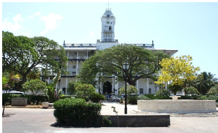
Undrens hus i gamla stenstaden, Zanzibar

KONTAKT: Curomed Utbildning AB Håkmark 213, 905 91 UMEÅ Tel: 070-2871708 (Sara Sahlin), 070-3837510 (Tore Sahlin) E-mail: info@curomed.se